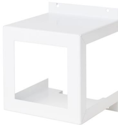
Рисунок 1 - Общий вид защитного кожуха

1.2 Общий вид защитного кожуха показан на рисунке 1.