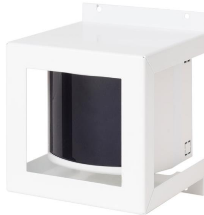
Рисунок 3 - Общий вид извещателя, защищенного кожухом

Общий вид извещателя, защищенного кожухом, показан на рисунке 3.