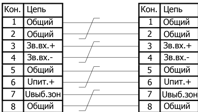
Рисунок 1 Схема соединения кабеля

1 Для подключения удаленного ВПУ-4 к прибору «Октава-80Ц» на расстояние до 50 м использовать кабель UTP 4x2x0,5 cat5e. Разделка кабеля под разъем должна производиться в соответствии со схемой соединения, приведенной на рисунке 1, с соблюдением парности витых проводов и условного обозначения контактов разъема Rj-45.